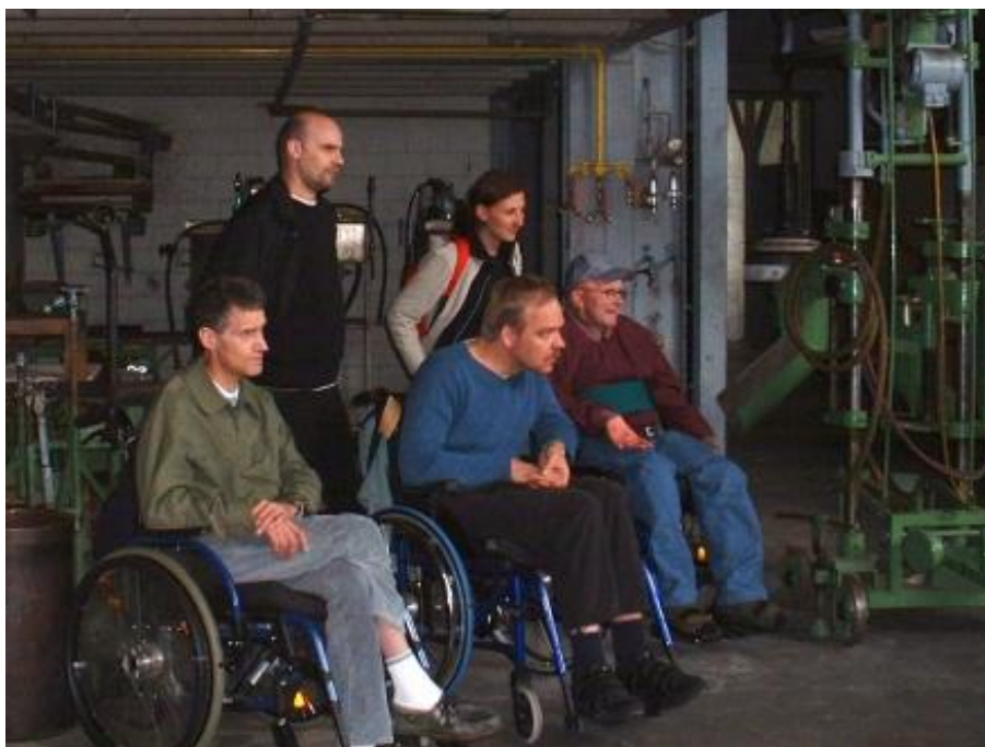
Besuch Glasi Hergiswil

Vom 17. bis zum 24. Mai 2008 fand erstmals ein Ferienlager des IWAZ Wetzikon statt. Zwölf Heimbewohner reisten ins Ferienhaus Domino in Lungern OW. Begleitet wurden sie von Betreuern der ZSO Wetzikon-Seegräben. Diese unterstützten die vier ebenfalls angereisten Pflegefachpersonen des IWAZ und weitere freiwillige Helfer. Insgesamt leisteten 20 Zivilschützer Dienst. Die erste Gruppe war vom 17. bis zum 20. Mai, die zweite vom 20. bis und mit 24. Mai 2008 in Lungern stationiert. Von den jeweiligen Zehnergruppen wurden vier Personen für den Küchenbetrieb und sechs für die Unterstützung bei der Betreuung der IWAZ-Heimbewohner eingesetzt.